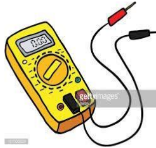
Testing & Commissioning